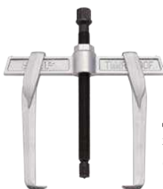
Демонтаж с захватом снаружи