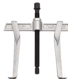
Демонтаж с захватом изнутри