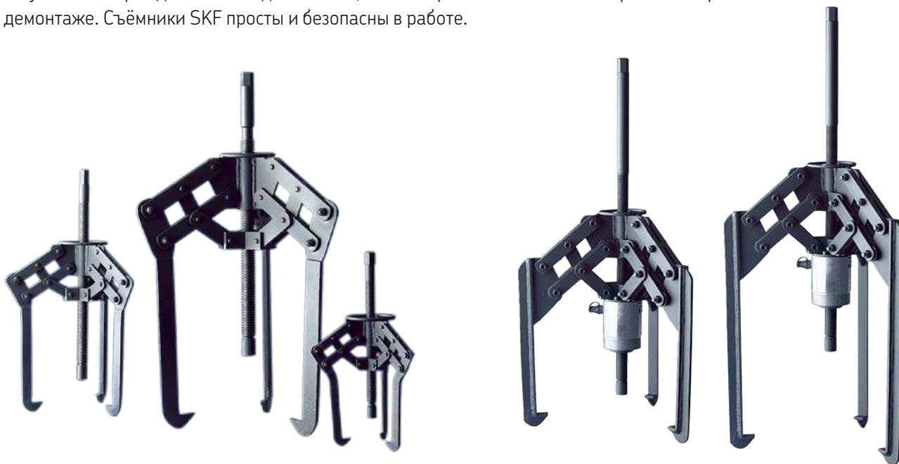
Мощные самоцентрирующиеся механические съёмники

Наиболее эффективным способом демонтажа мало- и среднегабаритных подшипников качения является использование механических съёмников. Съёмники SKF обеспечивают отсутствие повреждений как подшипников, так и сопряжённых с ними поверхностей при демонтаже. Съёмники SKF просты и безопасны в работе.